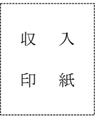
※印紙税額は裏面参照